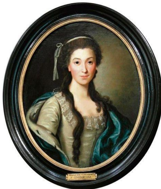
Portret księżnej Izabelli Czartoryskiej